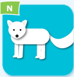
N arctic fox renard polaire