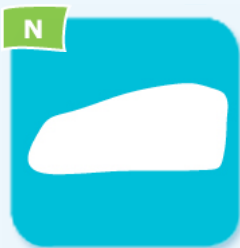
N iceberg iceberg