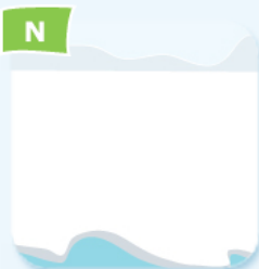
N ice glace