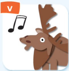
V call appeler