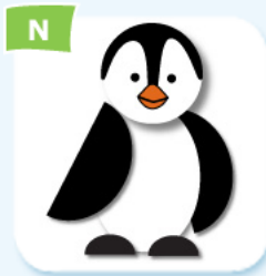
N baby bébé