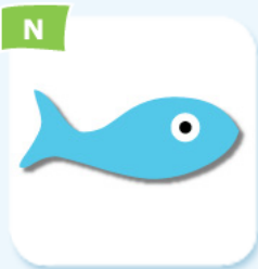
N fish poisson