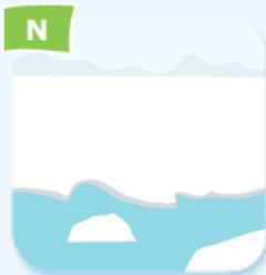
N glacier banquise