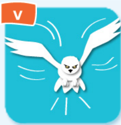
V fly voler