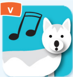
V howl hurler