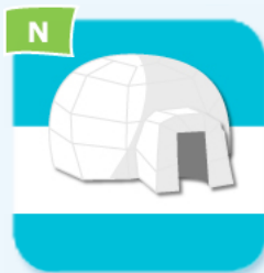
N igloo igloo