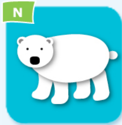
polar bear ours polaire