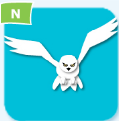
snowy owl harfang des neiges