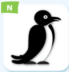
N auk pingouin