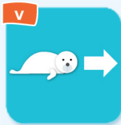
V glide glisser