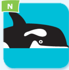
killer whale orque