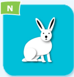
N arctic hare lièvre polaire