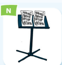
music stand pupitre