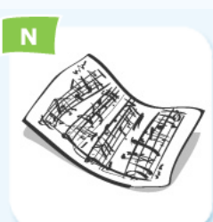
music sheet partition