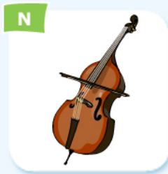
double bass contrebasse