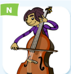
double bass player contrebassiste