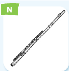
flute flûte traversière