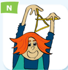
triangle player joueur de triangle