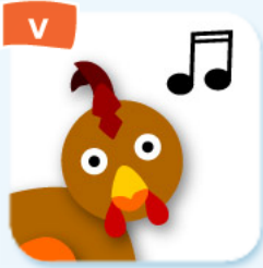
crow chanter (coq)