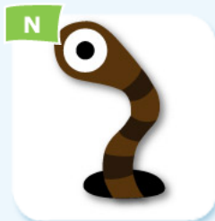
earthworm ver de terre