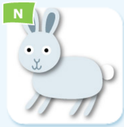
baby rabbit lapereau