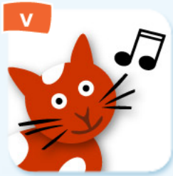
mew miauler (chaton)