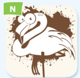
pink flamingo flamant rose