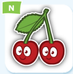
N cherry cerise