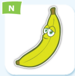
N banana banane