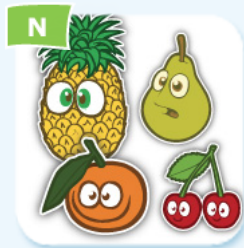
N fruit fruit