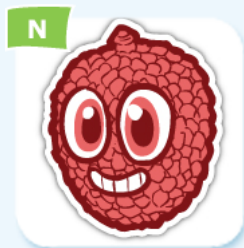
N lychee litchi