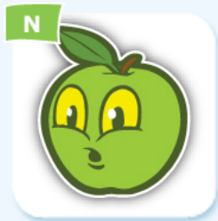
N apple pomme