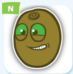
N kiwi kiwi