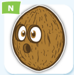
N coconut noix de coco