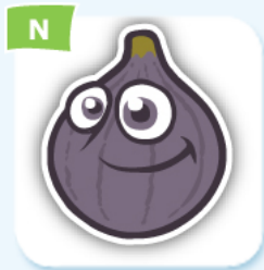
N fig figue