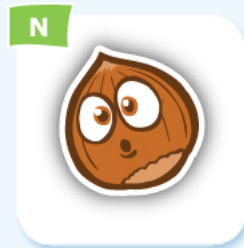
N hazelnut noisette