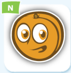
N apricot abricot