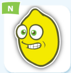
N lemon citron