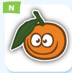
N clementine clémentine