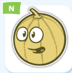
N melon melon