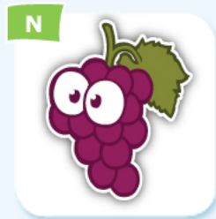
N grape raisin