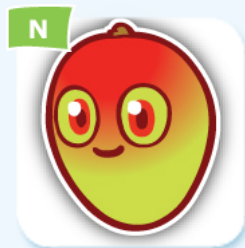
N mango mangue